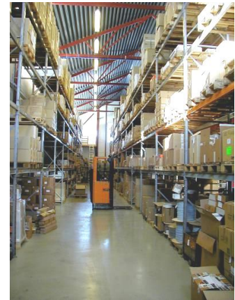
Logistikk i Risør

Lager i Norge gir kort leveringstid og god service.