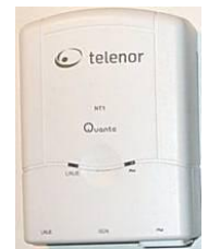
NT1 ISDN (½ mil)