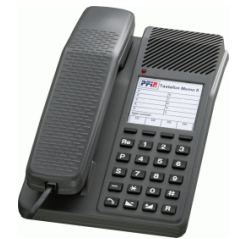
Memo (1,5 mil)

1988 , PFI blir etablert som knoppskyting fra EB i Risør. 1997, PFI leverer sin første egne ISDN telefon. 1998, O.Østmo blir hovedleverandør av ISDN NT1, til Telenor.